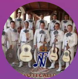
Mariachi Nuevo Tecalitlan