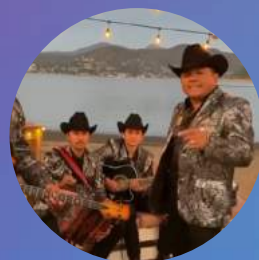
Alegres de la sierra